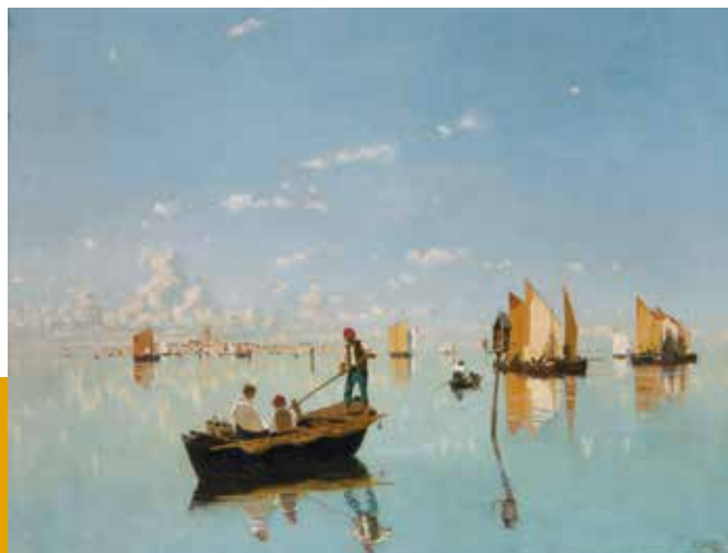
Guglielmo Ciardi Vele al sole, 1878 Collezione privata