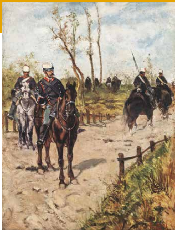
Giovanni Fattori Pattuglia di artiglieria, 1885 circa Lugano, Collezione Durrefry Institute Fine Art, Galleria d'arte, grandi maestri dell'800 e '900