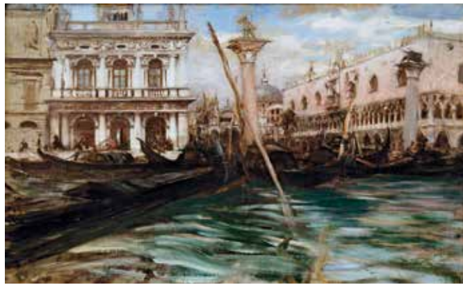
Giovanni Boldini Il molo a Venezia, 1900 Collezione privata